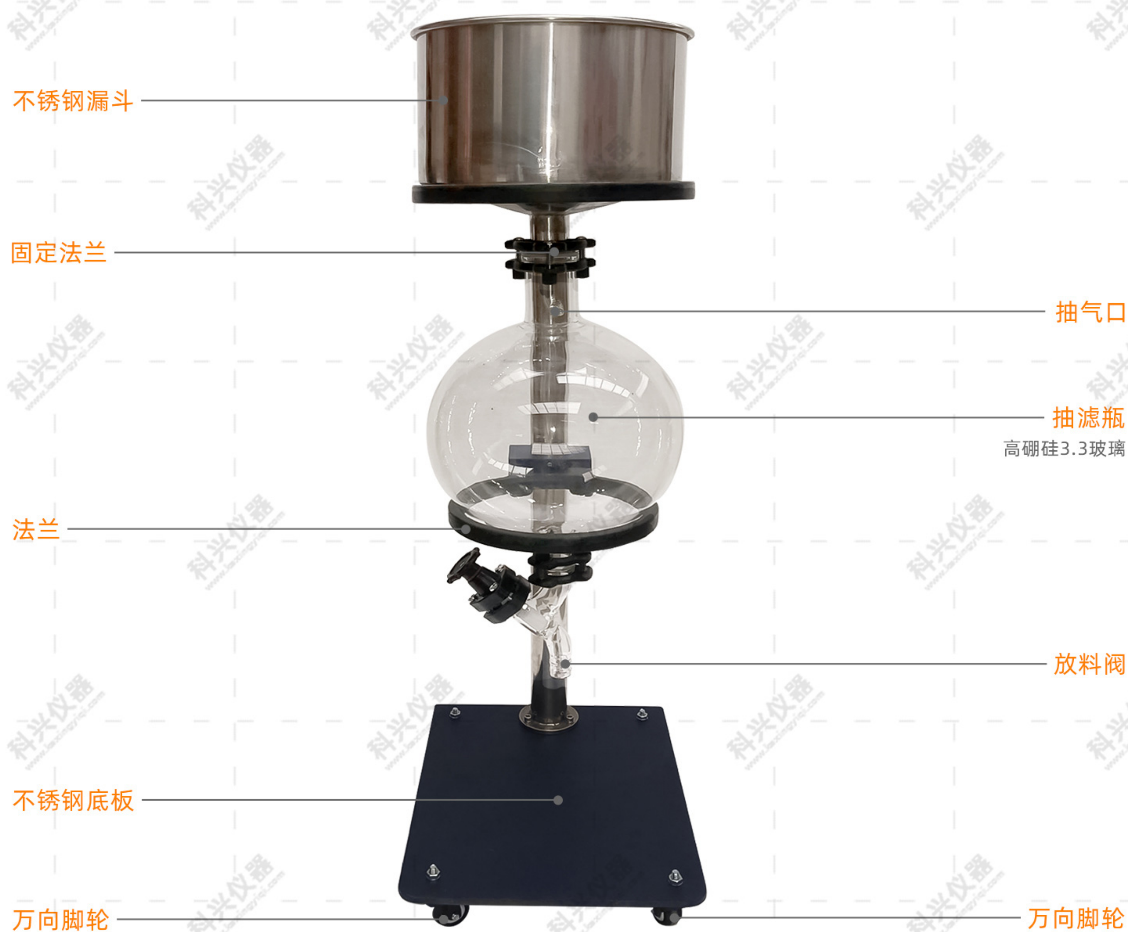
真空抽滤器(不锈钢材质)